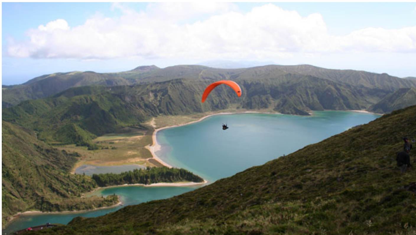
Paragliding_Fogo Lake

Pour profiter de tout le charme de la nature , nous préférons des activités plus calmes. Comme les randonnées pédestres ou à cheval , en respirant l'odeur des fleurs sauvages, par une belle journée de soleil. Ou encore l'alpinisme, qui en plus des panoramas fabuleux propose aux plus courageux d'atteindre les sommets les plus élevés, avec l'avantage d'admirer les nids et les vols des rapaces. Il y a aussi des excursions en bateau pour observer les dauphins et les baleines , images vraiment inoubliables !