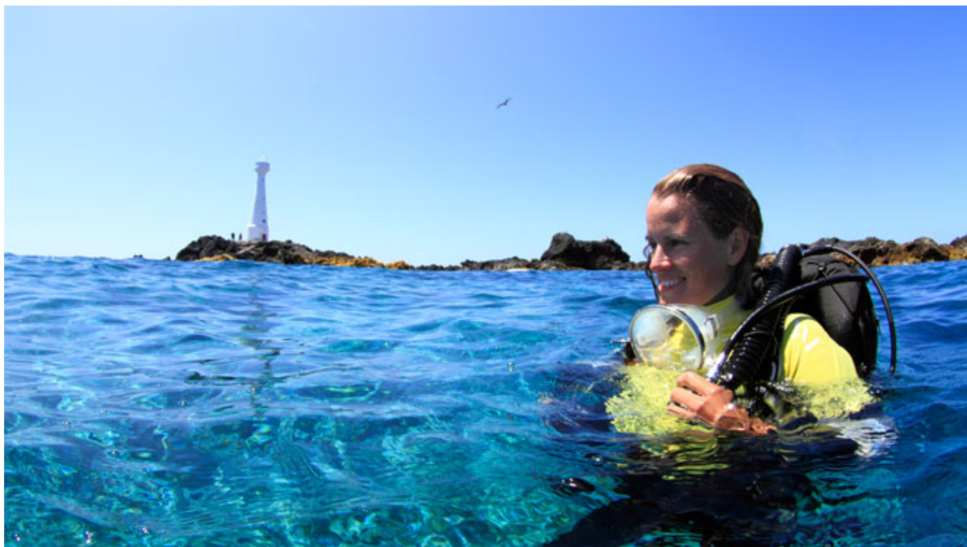
Diving in Azores_ Formigas Islets

La storia del Portogallo annovera numerose imprese di navigatori intrepidi che hanno attraversato mari sconosciuti, superando tempeste e insidie per raggiungere l'altra parte del mondo. Oggi si naviga con l'aiuto delle tecnologie più sofisticate, ma i portoghesi conservano la stessa passione per il mare e l'avventura, e, inoltre, amano accogliere con ospitalità e simpatia i turisti .