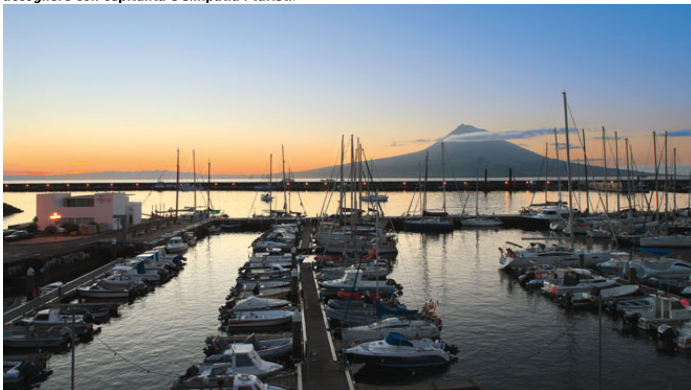
Horta Marina_Faial Island_Azores

La storia del Portogallo annovera numerose imprese di navigatori intrepidi che hanno attraversato mari sconosciuti, superando tempeste e insidie per raggiungere l'altra parte del mondo. Oggi si naviga con l'aiuto delle tecnologie più sofisticate, ma i portoghesi conservano la stessa passione per il mare e l'avventura, e, inoltre, amano accogliere con ospitalità e simpatia i turisti .