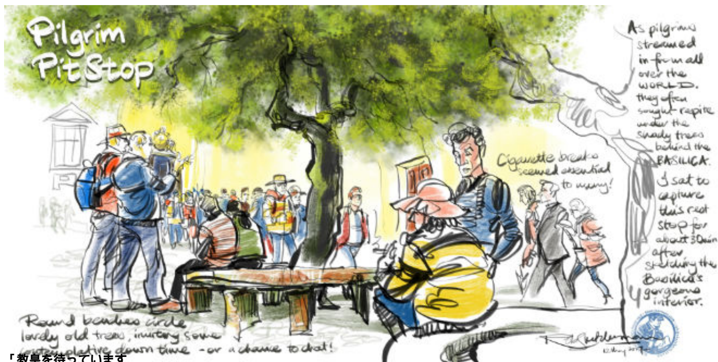
「教皇を待っています 待って...待って...待ち続けています。」