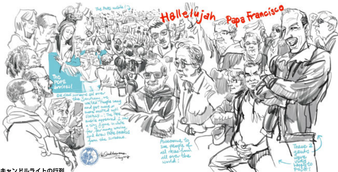
キャンドルライトの行列