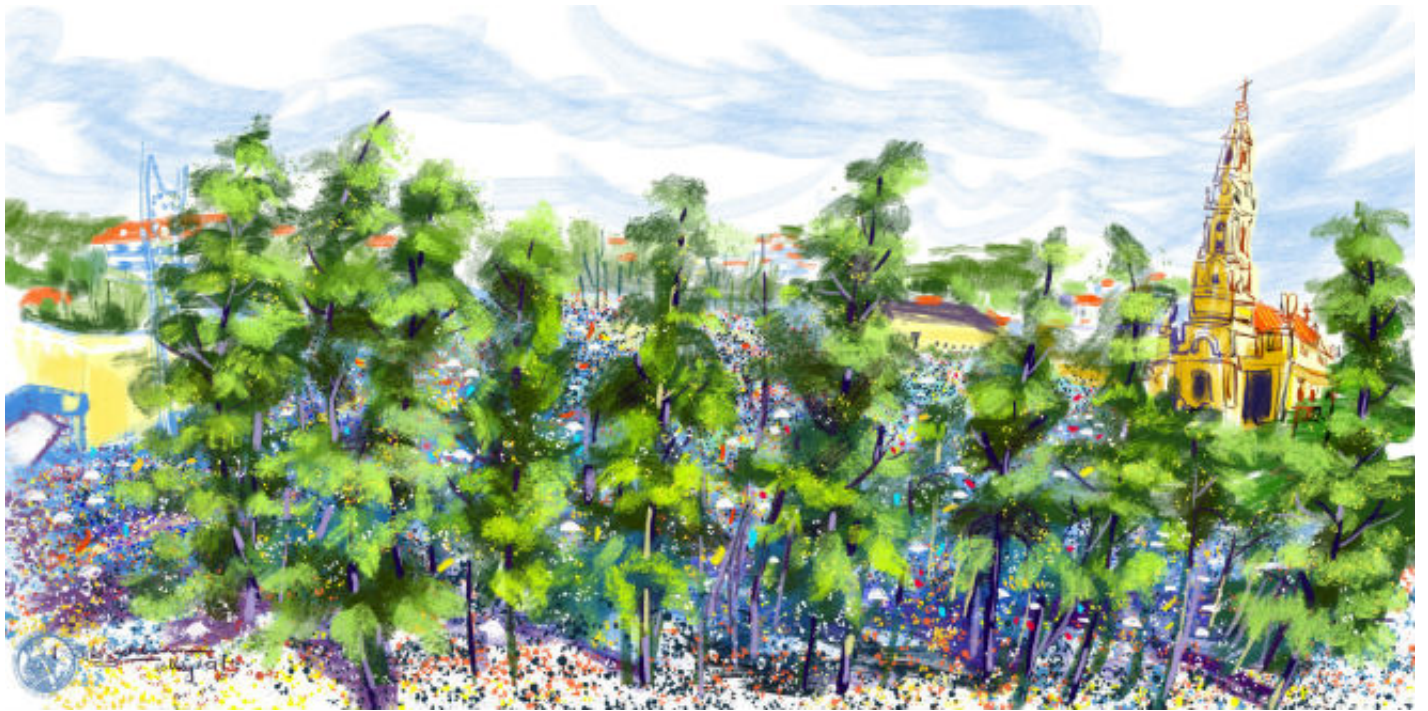
バリンhos [Valinhos] 子どもたちの前に天使が初めて現れた場所