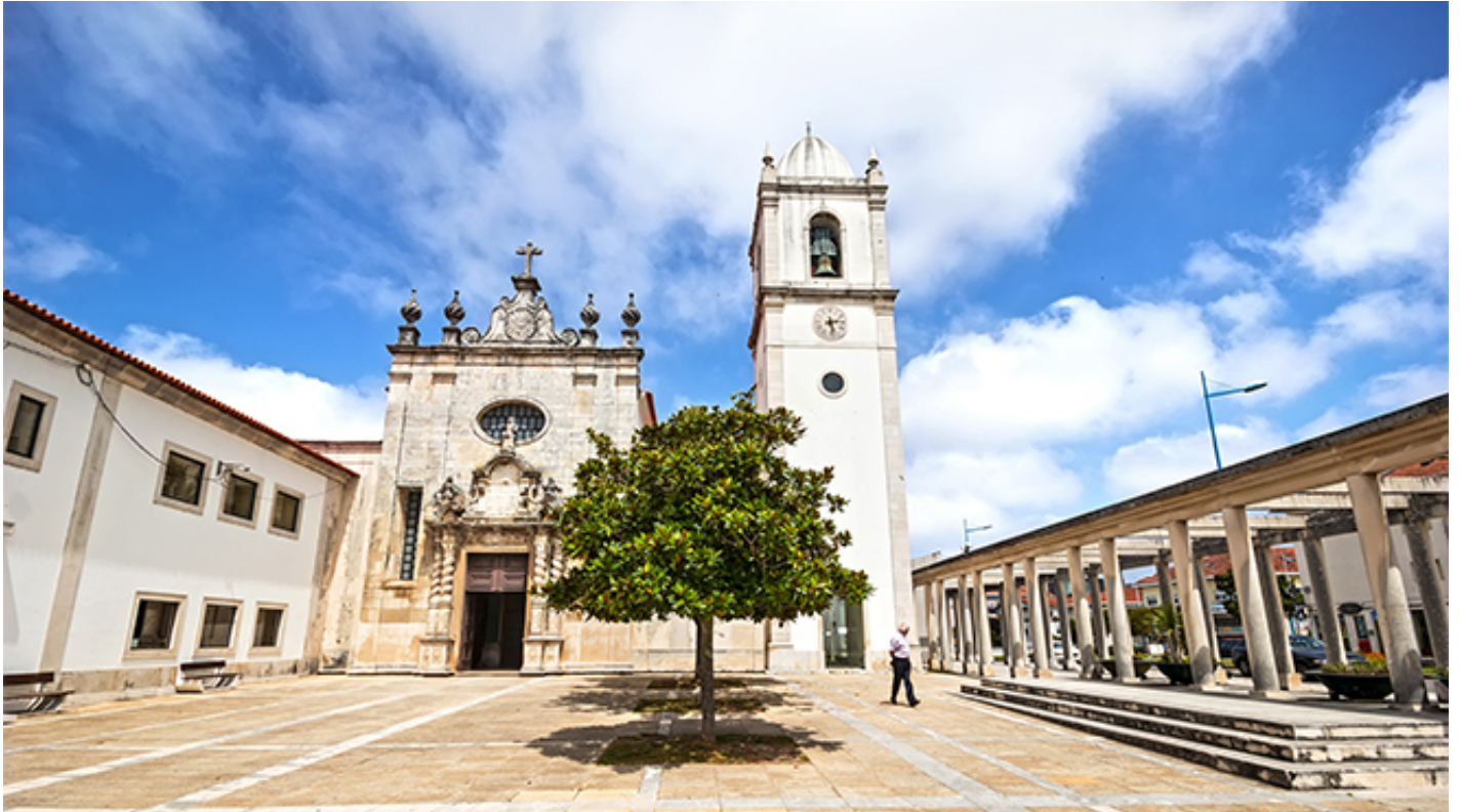
Sé Catedral de Aveiro

5番街[Avenida 5 de Outubro]を通過した後に、入り口に障害のない大聖堂( Cathedral )