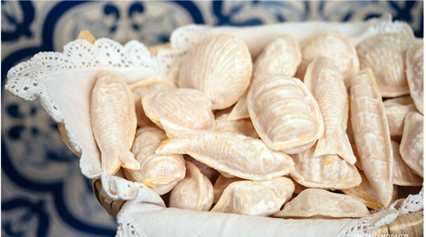
Ovos Moles de Aveiro

アヴェイロの訪問中に是非、オヴォシュ・モーレシュ[ovos moles](卵黄と砂糖を混ぜ合わせて作ったお菓子)で有名な修道院の菓子店など、現地の美食や地域ならではの名物もお楽しみください。オヴォシュ・モーレシュは街全体にある菓子屋でも販売しています。