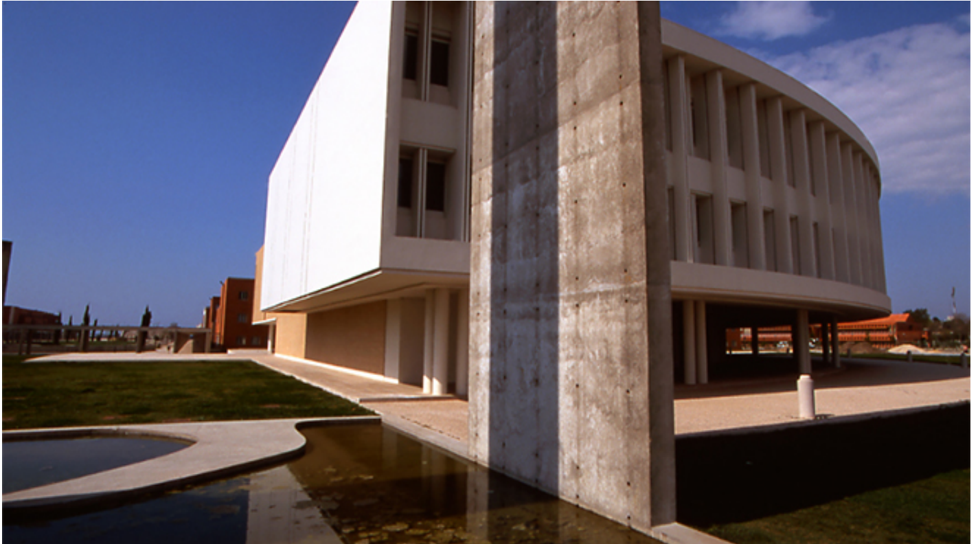
Universidade de Aveiro

サンタ・ファナ通り[Avenida Santa Joana]と呼ばれるアヴェイロ美術館通り[Avenida do Museu de Aveiro]を進むと、D.ペドロ王子公園(12)、サンフランシスコ教会(13)、そしてシザ・ヴィエイラ[Siza Vieira]、ソウト・デ・モウラ[Souto de Moura]、アルシーノ・コーチンホ[Alcino Coutinho]、カリーリョ・ダ・グラサ[Carrilho da Graça]、ゴンサロ・バーン[Gonçalo Byrne]といった著名な建築家が手がけたアヴェイロ大学のキャンパス[Campus Universitário de Aveiro]