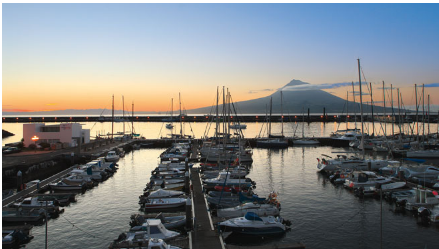
Horta Marina_Faial Island_Azores

A História de Portugal está repleta de feitos de navegadores que atravessaram mares desconhecidos dobrando cabos e tormentas, para alcançar o outro lado do mundo. Hoje em dia, navega-se com o apoio das mais sofisticadas tecnologias, mas mantemos o gosto pelo mar, pela aventura e por acolher bem todos os que nos visitam .