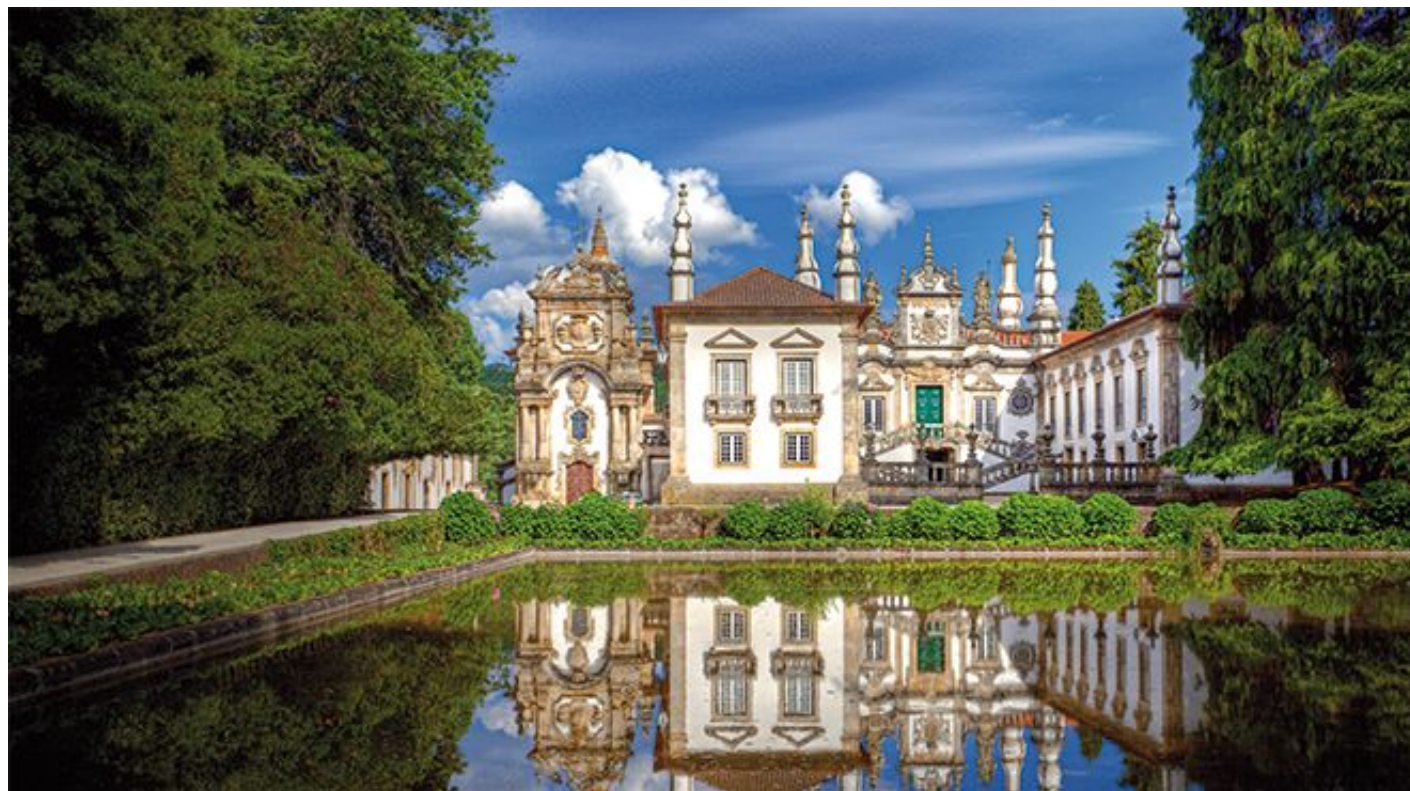
Photo: Casa de Mateus, Vila real © Porto Convention & Visitors Bureau