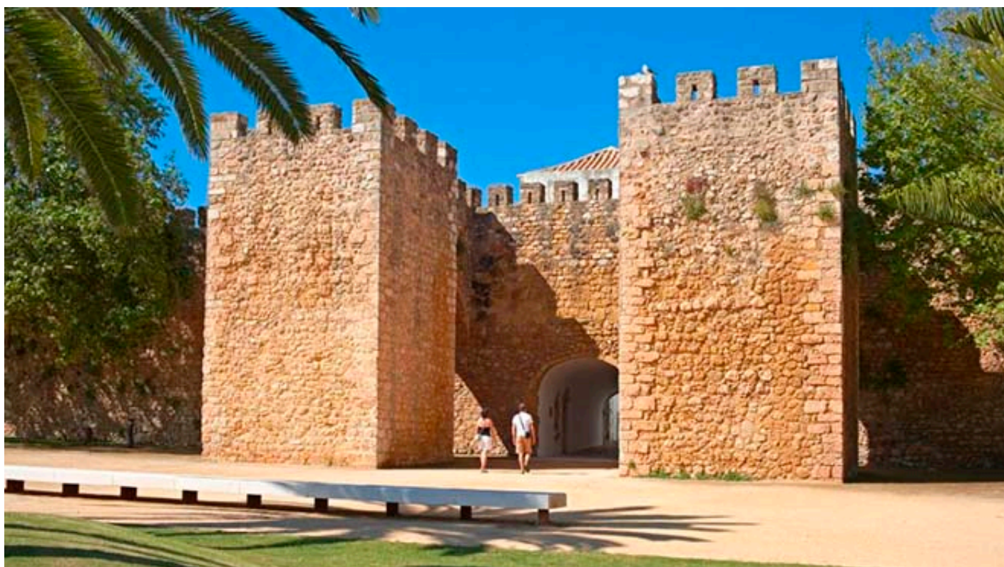
Castelo dos Governadores - Lagos

Nas proximidades, com entrada pela Praça Infante D. Henrique (4), um largo amplo e totalmente acessível, fica a Igreja de Santa Maria (3) em que um degrau na entrada impossibilita o acesso autónomo. Este templo data do século XV, mas foi restaurado e ampliado posteriormente, tendo ganho sobretudo em elementos decorativos de que são exemplo os retábulos do séc. XVIII.