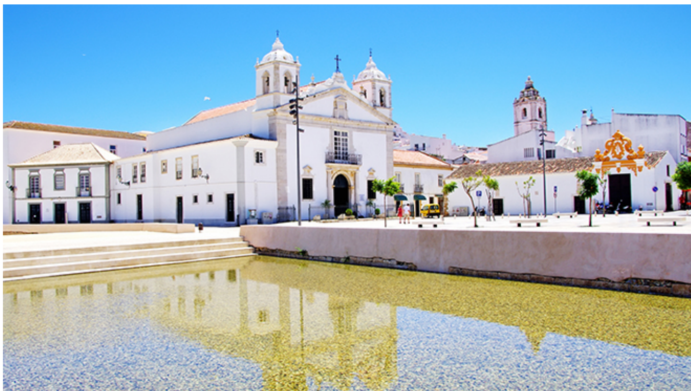
Praça Infante D. Henrique | Igreja de Santa Maria - Lagos

Nas proximidades, com entrada pela Praça Infante D. Henrique (4), um largo amplo e totalmente acessível, fica a Igreja de Santa Maria (3) em que um degrau na entrada impossibilita o acesso autónomo. Este templo data do século XV, mas foi restaurado e ampliado posteriormente, tendo ganho sobretudo em elementos decorativos de que são exemplo os retábulos do séc. XVIII.