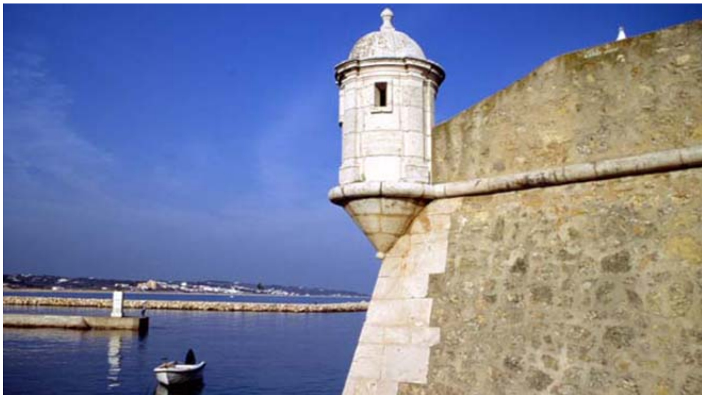
Forte Ponta da Bandeira - Lagos

Lagos conta também com diversas praias acessíveis , como por exemplo as Praias da Batata , da Luz , de Porto de Mós e a Meia Praia , estas três últimas com cadeira anfíbia para que todos possam usufruir em pleno dos banhos de sol e o mar.