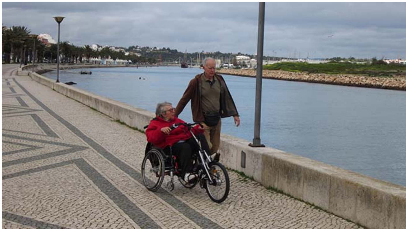
Avenida dos Descobrimentos

Seguindo em direção ao mar vai voltar à Avenida dos Descobrimentos (8) onde se situa a ponte pedonal que faz a ligação com a Marina de Lagos (10). Neste espaço, onde estão ancoradas muitas embarcações, encontra-se a Caravela Boa Esperança (9), uma réplica das antigas caravelas portuguesas, cujas características exteriores poderá admirar já que a entrada é inacessível e o espaço interior diminuto dificulta a circulação. Na Marina encontram-se diversas áreas de lazer, bem como o Museu de Cera dos Descobrimentos (11), um espaço acessível onde poderá ficar a saber mais sobre a grande epopeia marítima dos portugueses.